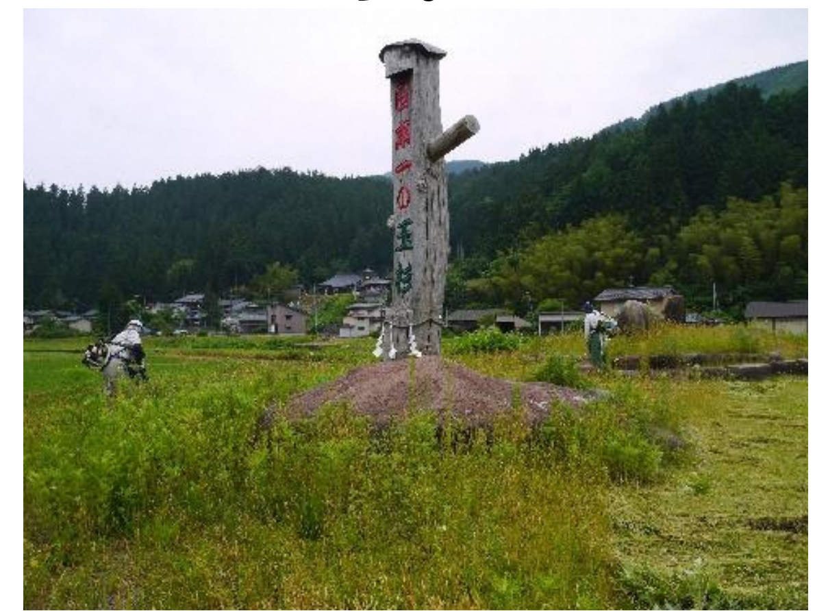
玉杉モニュメント