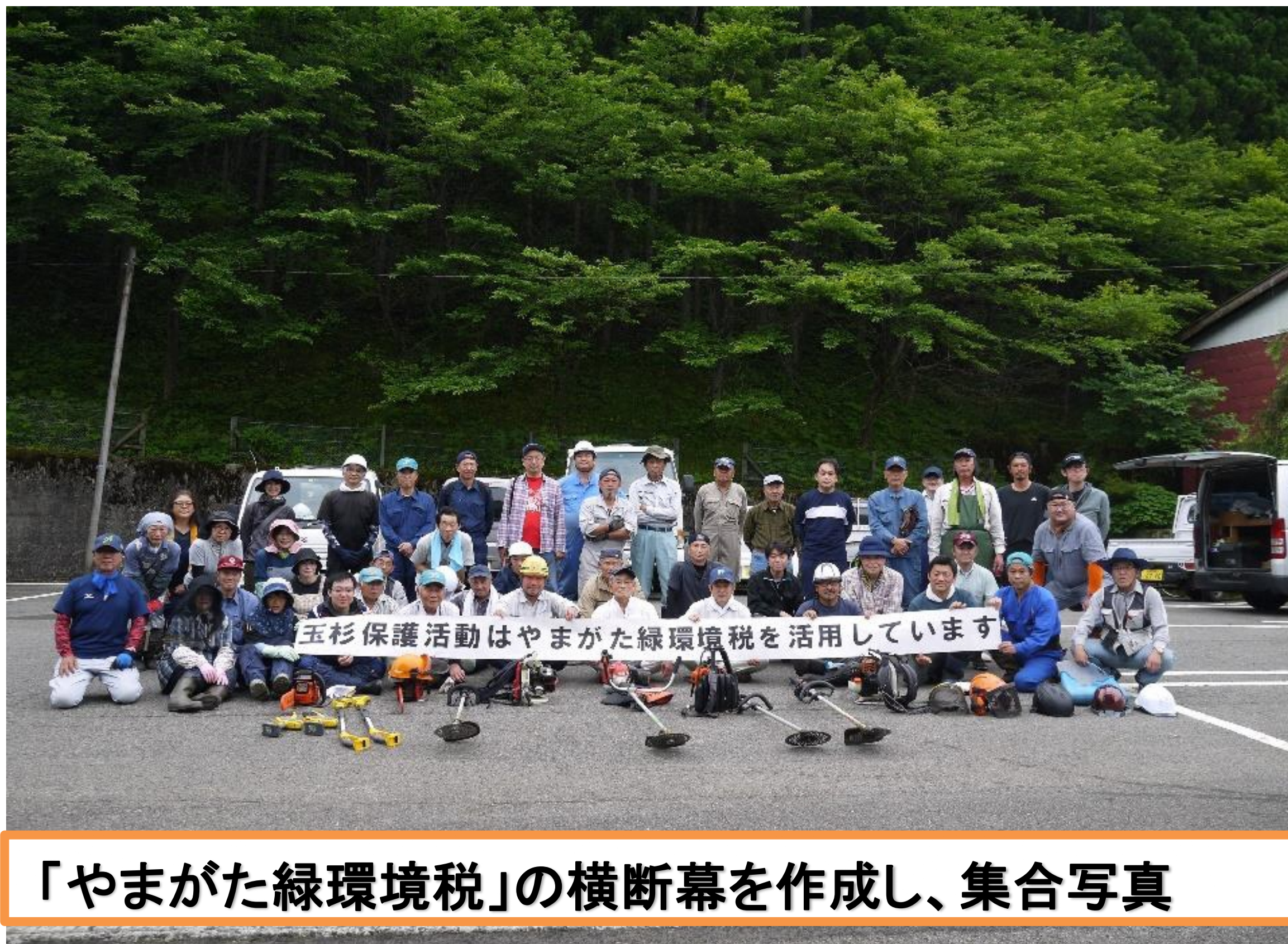
「やまがた緑環境税」の横断幕を作成し、集合写真